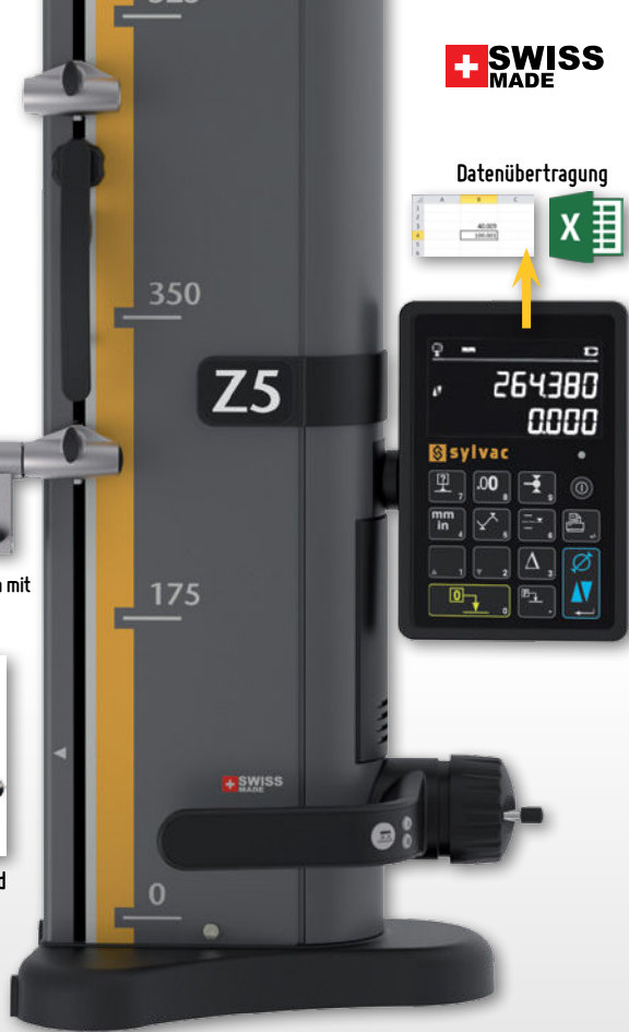
Lieferung mit Rubin-Messtasten mit einem Durchmesser von 4 mm