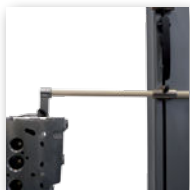
Messung mit langen Tasten