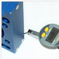
Überprüfung der Rechtwinkligkeit