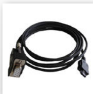
Spezial mini-RS232 Kabel für PC-Anschluss (Ref. 926.5505)